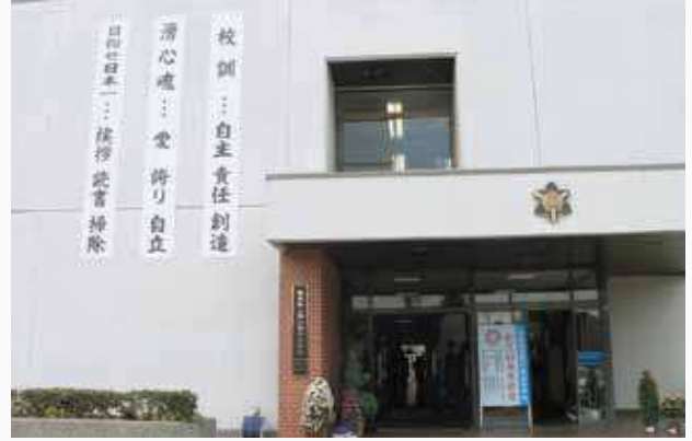
玄関にひときわ目立つスローガン