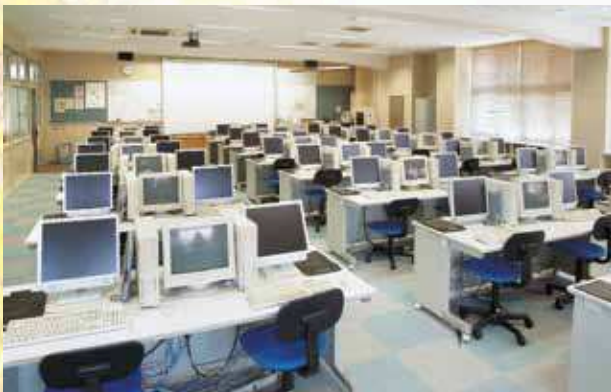
情報処理の機器群