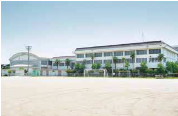
運動場より第一第二体育館を望む