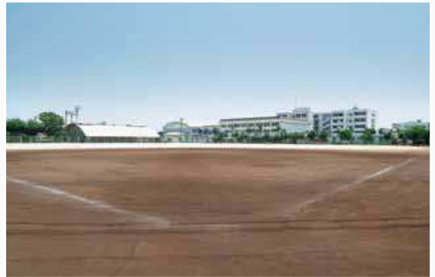
野球場より校舎を望む